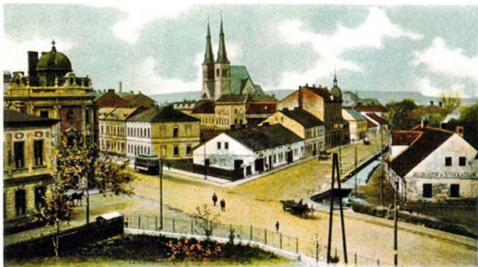
Gruss aus Oderfurt.

1. Probírám se pohlednicemi Ostravy a nestačím se divit, jak se ta naše „šumná Ostrava“ za tak krátký čas proměnila. Jak vypadá jinak, jak je v něčem i krásnější. Stačí pozvednout oči od výloh výkladních skříní a podívat se kolem na krásná průčelí domů dnes již historických ostravských staveb. To by měl občas udělat každý z nás. Zajímavé letité fotografie nám tuto krásu v původní podobě uchovaly. A je jich hodně. Od počátků průmyslového a architektonického rozmachu města po dnešek. Jsou to nenahraditelné dokumenty. Mají cit, přesnost, estetický rozměr, jsou poučné a dovedou vyprávět příběhy.