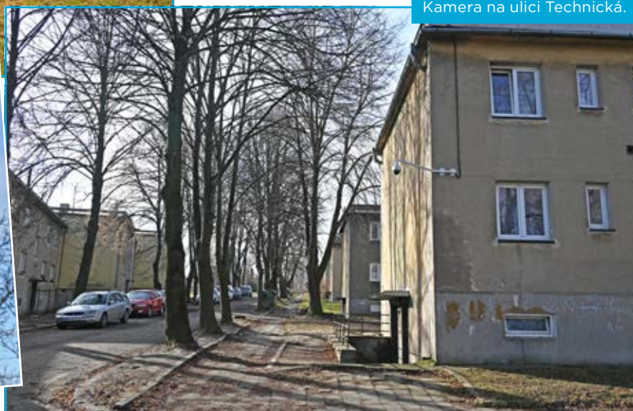
Kamera na ulici Technická.