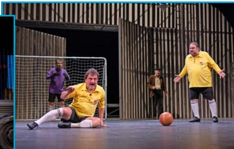
Slezská Ostrava, dějiny a fotbal.

To jsou hlavní body osnovy Lapáčkova životního příběhu.