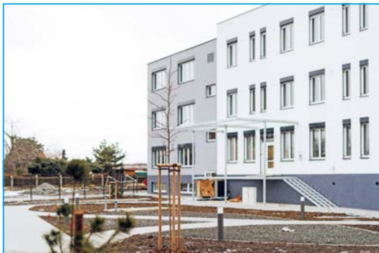
Současná podoba domova pro seniory.

Prováděno je i dřevěné obložení zadní terasy a předního vstupu. Pokračovat se bude se stavebními pracemi v prvním patře a v suterénu a na chodbách bude doplněno zábradlí a moderní nábytek do jednotlivých pokojů a společenské místnosti – postele, křesla, stoly, kuchyňské linky. Pro zajištění bezbariérového přístupu do zahrady bude z terasy nainstalována plošina pro invalidní vozíky. Na závěr budou provedeny terénní úpravy.