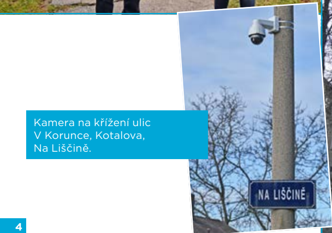
Kamera na křížení ulic V Korunce, Kotalova, Na Liščině.