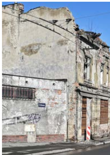
Starý a nový Hrušov.