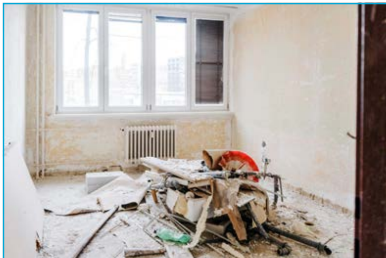
Byty v domě na Dědičné ulici v rekonstrukci.

Městský obvod očekává, že o bydlení tohoto typu bude mezi vysokoškoláky veliký zájem. Studenti mají na Dědičné ocenit zejména možnost bydlení v soukromí a také blízkost univerzity i centra města.